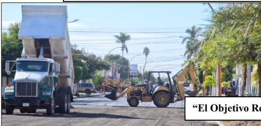
"El Objetivo Regional"

Intensifican Rehabilitación de Calles en Navojoa