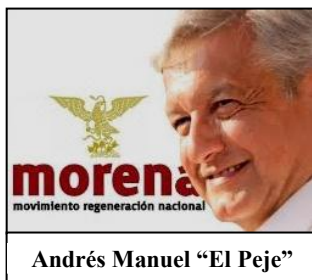
Andrés Manuel “El Peje”