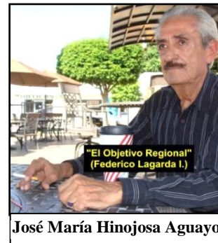
José María Hinojosa Aguayo