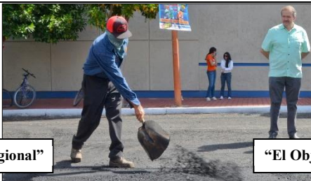
"El Objetivo Regional"